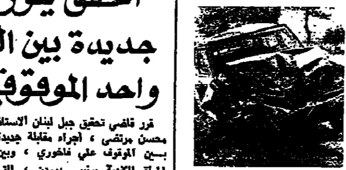
السيارة كما بدت بعد الاصطدام

زحلة - من مراسل «الانوار» اجتاحت سيارة «تويوتا» تحمل الرقم 158968 عمود كهرباء على طريق ابلح - ريان ليل امس الاول